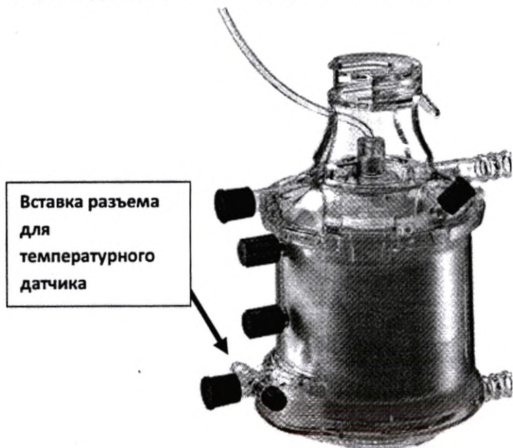
Изображение 1. Расположение разъема для температурного датчика на оксигенаторе Affinity Fusion

В жалобах указывается на то, что разъем для температурного датчика (его расположение см. на изображении 1) отсоединяется от оксигенатора либо во время настройки перфузии перед процедурой, либо после процедуры при разборке перфузионного контура.